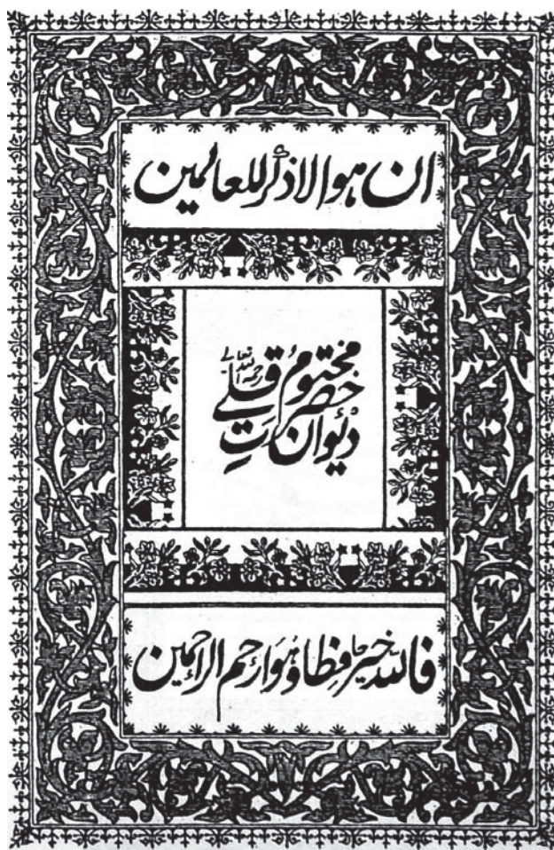
Рис. 2. Обложка “Дивана”

На этом листе, находящемся в центре прямоугольника, написано: “Диване-хезрети Махтумгулу” (Диван мудрого Махтумкули) (рис. 2).